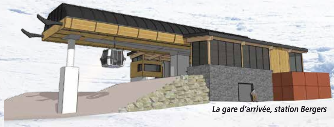
La gare d'arrivée, station Bergers

La mission de la SATA et ses priorités visent à accroître le confort des skieurs, réduire leur attente et améliorer leur sécurité. Pour y parvenir et aborder l'hiver 2018/2019 dans les meilleures conditions, la SATA a de nouveau engagé des investissements d'envergure.