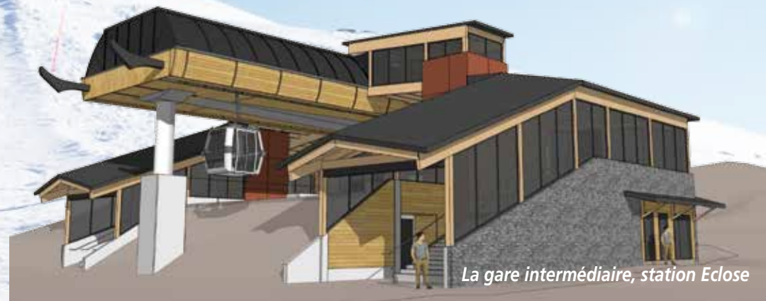
La gare intermédiaire, station Eclosé