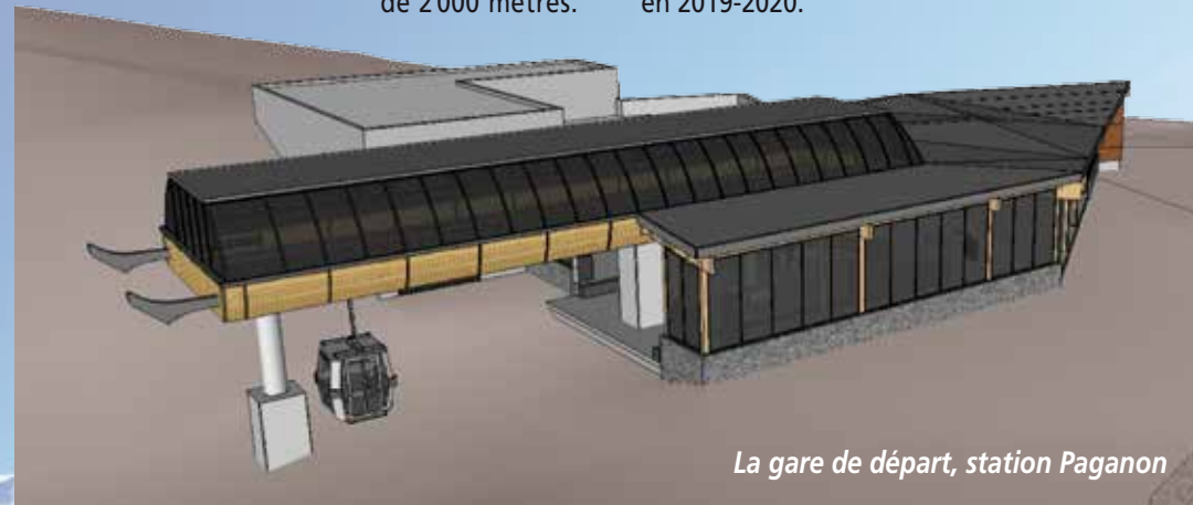
La gare de départ, station Paganon

Les travaux et aménagements réalisés par la SATA permettront une liaison Paganon-Bergers effective dès le mois de décembre 2018. La deuxième tranche (Huez/Paganon) sera réalisée en 2019-2020.